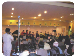
心温まるコンサートを開いています