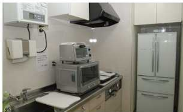
ファミリーキッチン