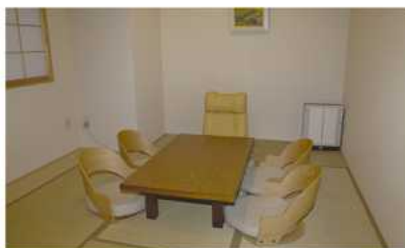
ゆったりと過ごせる家族室