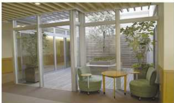
自然光が入る吹き抜けのテラス