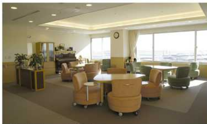
お茶会などのイベントができるデイルーム