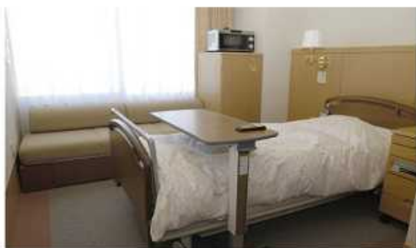
リラックスでき、プライバシーが守られた病室