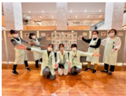
(担当スタッフ & ボランティアのメンバー)