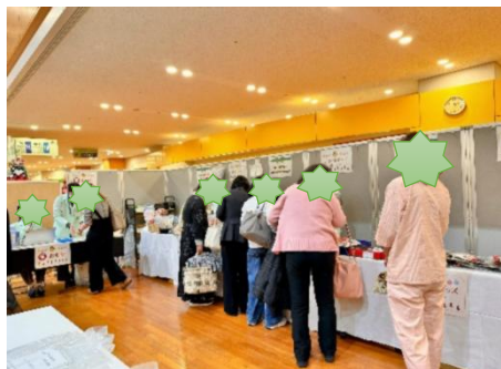
(お買い物を楽しまれる患者さん)

皆さまにお買い求めいただいたお代や募金を合わせまして、合計30万円もの寄付が集まりました。全額をがん研に寄付いたしましたので、ご報告いたします。皆さまの温かいお気持ち、本当にありがとうございました！！