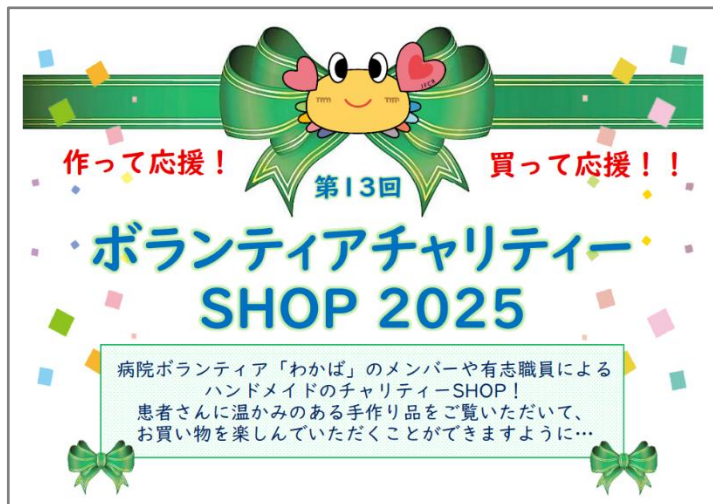
(チャリティーSHOP ポスター)