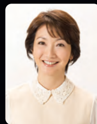
司会 向井 亜紀

チケットお申し込み方法 以下のいずれかの方法でお申し込みください。(2018年9月4日10時より発売開始)