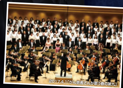
2017.4.1「がん患者さんが歌う第九」