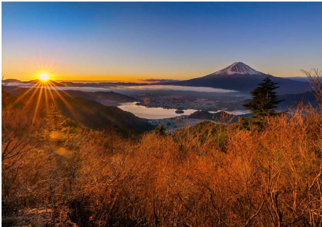
冬の朝、光のぬくもり 関口 陽子(看護部)