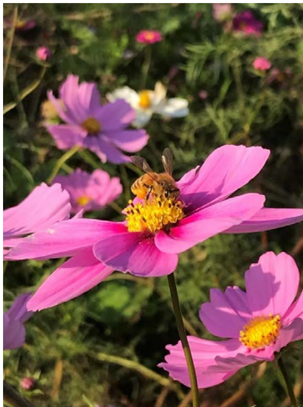
ハチとコスモス 日向 郁子(総務部医局秘書グループ)