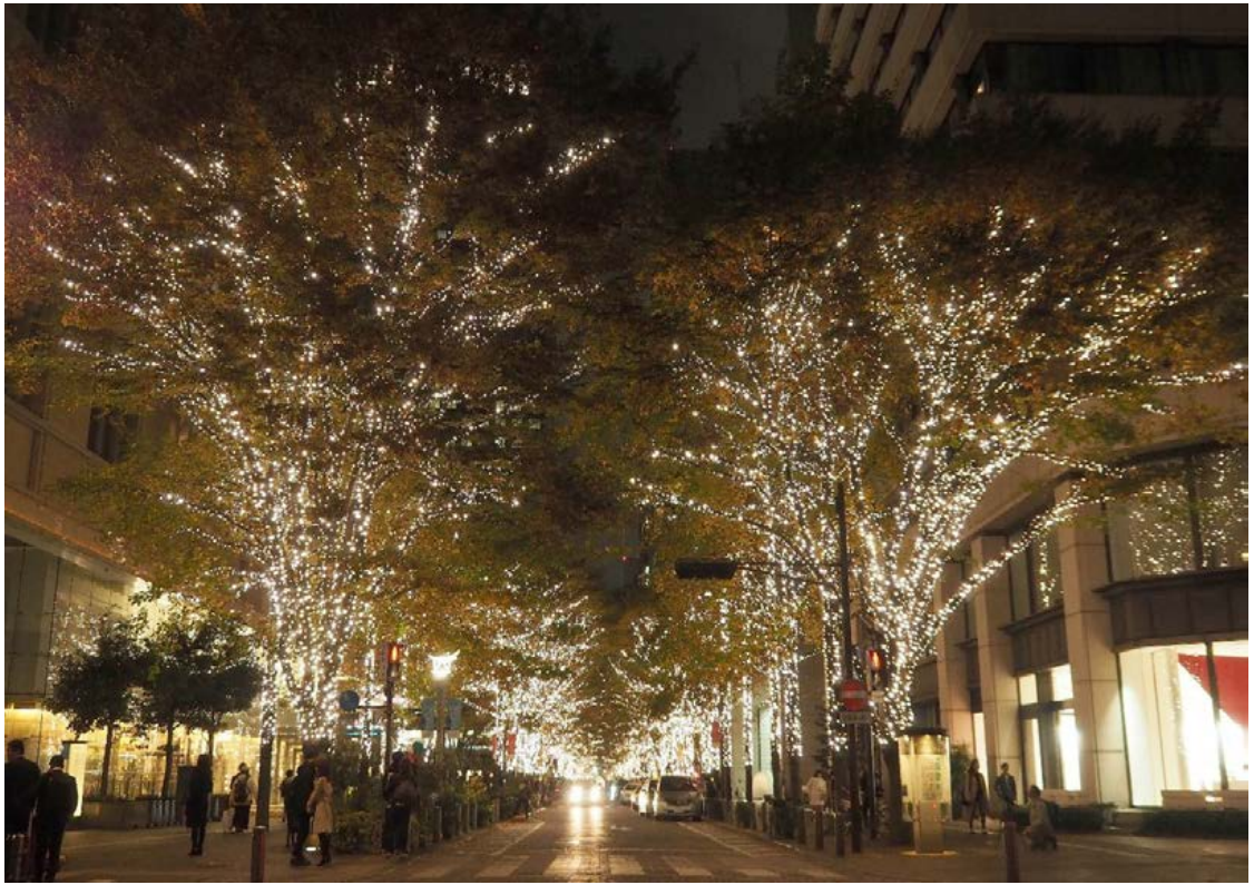
丸の内仲通りにて(2018年11月18日撮影)

Olympus OM-D E-M5 MarkII / M.ZUIKO ED 14-150mm F4.0-5.6