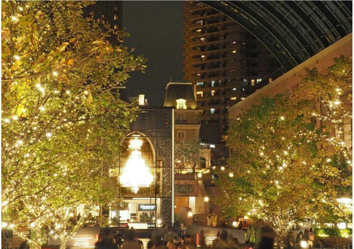
恵比寿ガーデンプレイスにて(2018年11月18日撮影)

Olympus OM-D E-M5 MarkII / M.ZUIKO ED 14-150mm F4.0-5.6