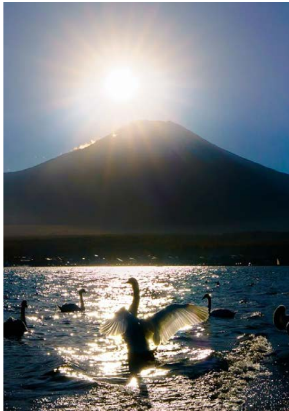
光の舞 関口 陽子(看護部)