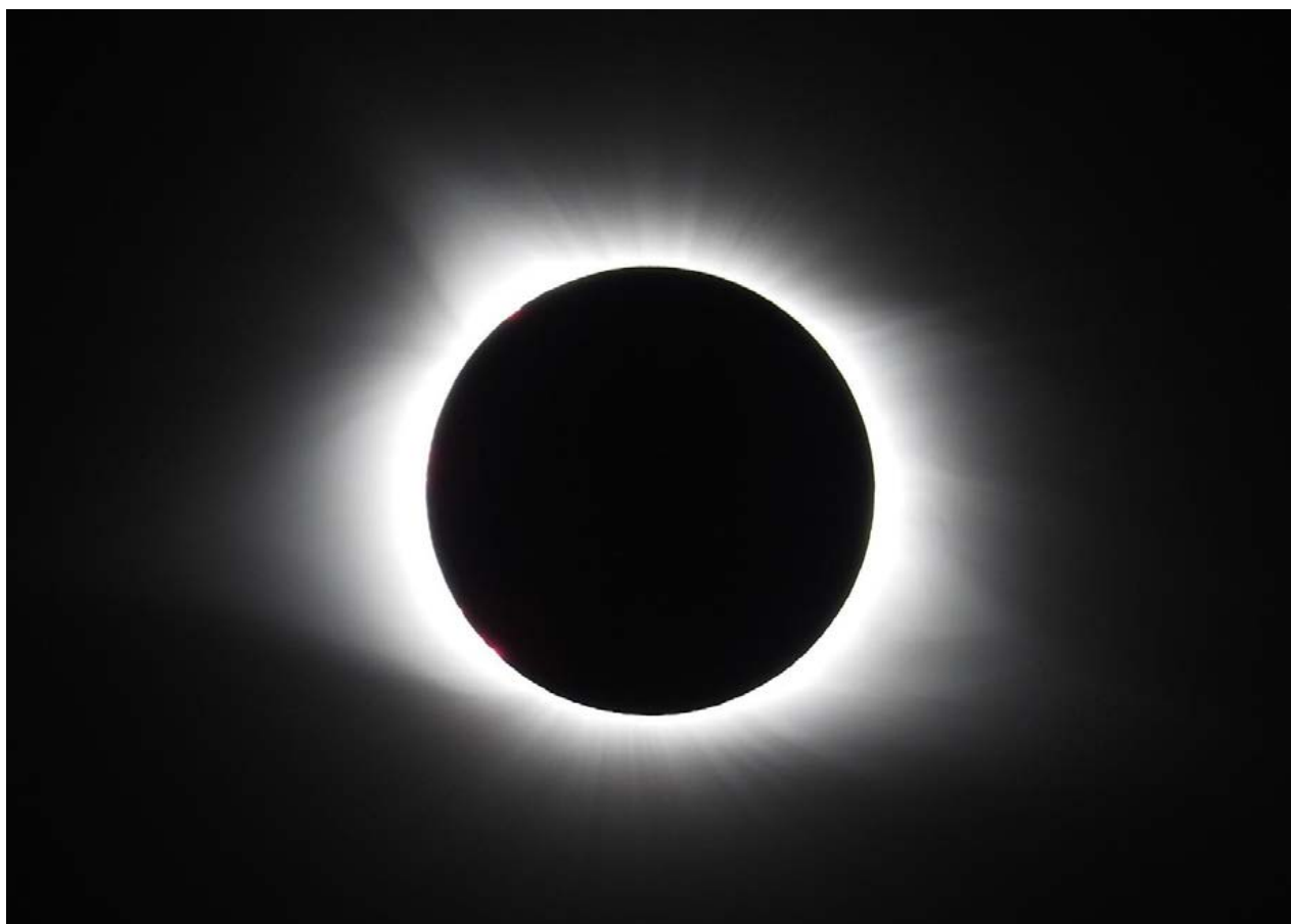
かくしたりかくされたり 棚倉 健太(形成外科)