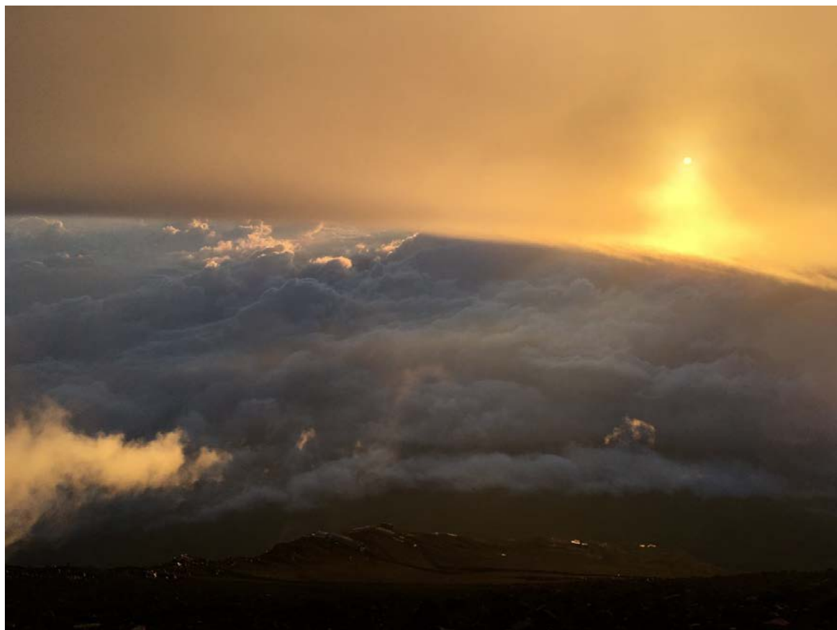
富士山からの初ご来光！ 萩野 茜(薬剤部)