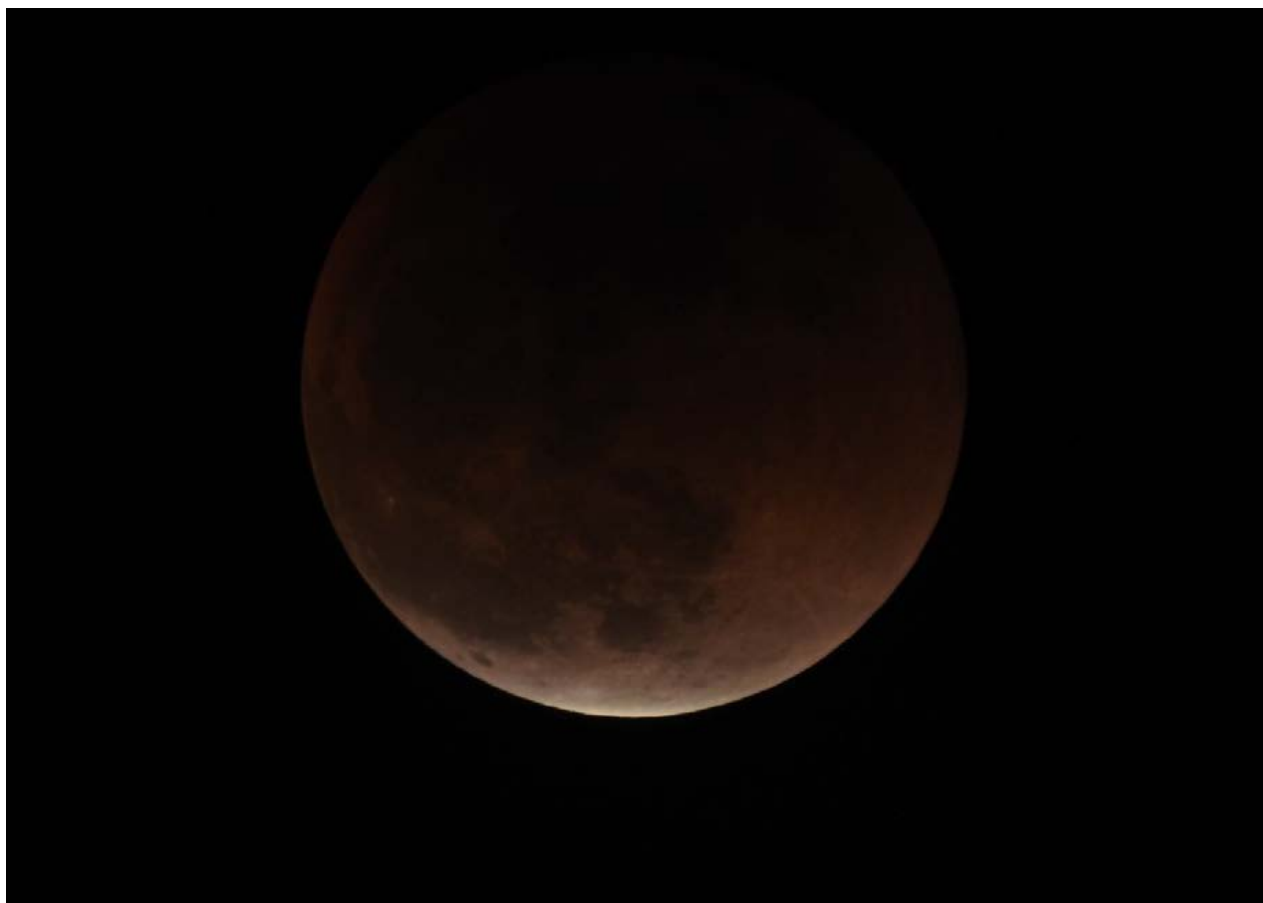
かくしたりかくされたり 棚倉 健太(形成外科)