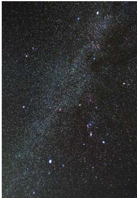
冬の天の川と大三角 赤澤 直樹(上部消化管内科)

FUJIFILM X-A5 + ZEISS Touit 12mm F2.8 Cokin ディフージョンフィルター2 使用と未使用の2枚合成 赤道儀使用 長野県浅間山麓 高峰高原にて