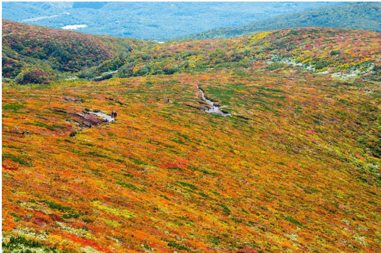
栗駒山の紅葉 楡山 博(経営本部長)