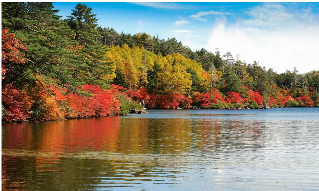
八ヶ岳白駒池の紅葉 楡山 博(経営本部長)