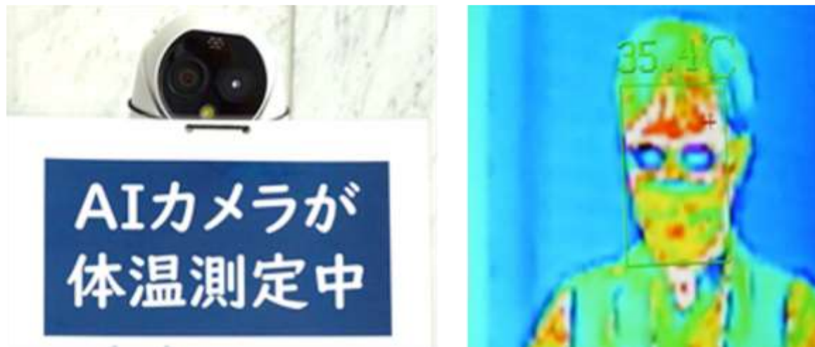
AIカメラが 体温測定中