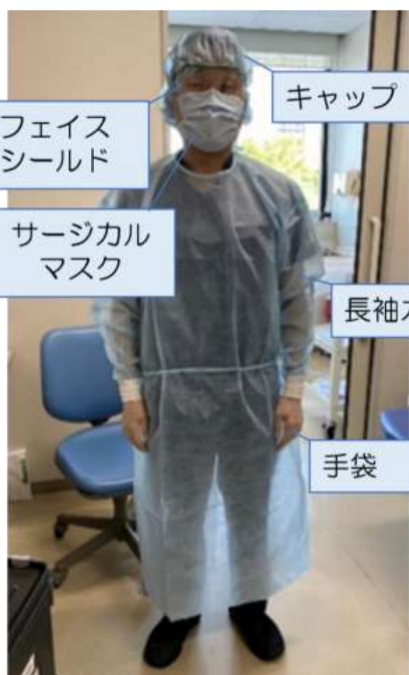
フェイスシールド キャップ サージカルマスク 長袖ガウン 手袋